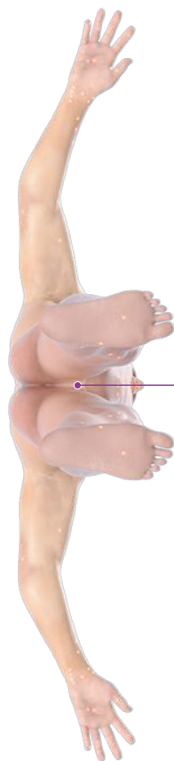
Схема акупунктурных точек